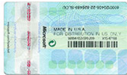
perbesar | Lihat versi sebelumnya

Untuk piranti lunak yang dibeli secara terpisah dari PC melalui saluran eceran, label COA akan ditempelkan pada sisi atas dari paket piranti lunak.