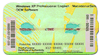
perbesar | Lihat versi sebelumnya dan bandingkan yang sekarang

Untuk perangkat lunak Windows yang sudah diinstal sebelumnya oleh manufaktur kecil (juga dikenal dengan Perakit Sistem) pada komputer, COA seharusnya ditempelkan di badan komputer. COA berisi kode kunci produk 25-karakter, yang mungkin akan diminta jika instalasi ulang diperlukan. Sebagian Perakit Sistem menyertakan perangkat lunak Windows bersama komputer baru namun belum diinstal. Komputer ini seharusnya disertainya dengan COA Windows Prainstal.