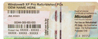
perbesar | Lihat versi sebelumnya dan bandingkan yang sekarang

Untuk perangkat lunak Windows yang sudah diinstal sebelumnya oleh manufaktur besar (juga dikenal dengan Original Equipment Manufacturer atau OEM) pada komputer, COA seharusnya ditempelkan di badan komputer. COA berisi kode kunci produk 25-karakter, yang mungkin akan diminta jika instalasi ulang diperlukan.